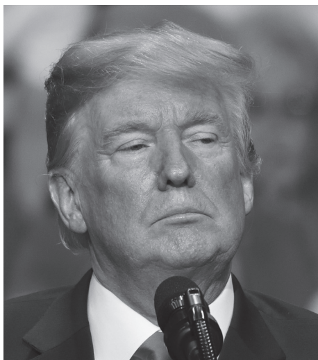
DONALD TRUMP L'ACTUEL PRÉSIDENT DES ÉTATS-UNIS. CARACTÉRISTIQUES PRINCIPALES DE L'AUTORITAIRE : POUVOIR ET COMPÉTITION

« Mon style de négociateur est très simple et direct. Je vise très haut et puis je continue à pousser et pousser et pousser jusqu'à ce que j'obtienne ce que je veux. Parfois, je me contente de moins que ce que je cherchais, mais dans la plupart des cas je finis tout de même par obtenir ce que je veux. »