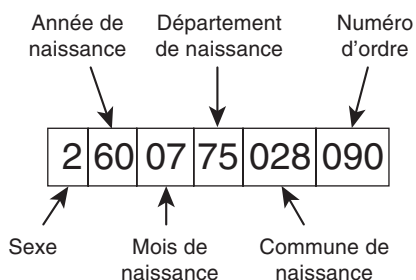
Figure 1.1 • L'interprétation d'un numéro de Sécurité sociale.

L'analyse du premier exemple va évoluer au fur et à mesure que les bonnes questions seront soulevées. Elle produira au final un programme très différent dans sa complexité. Prenons le problème de l'interprétation du numéro de Sécurité sociale (sans la clé finale). La signification des champs de ce numéro est indiquée à la figure 1.1.